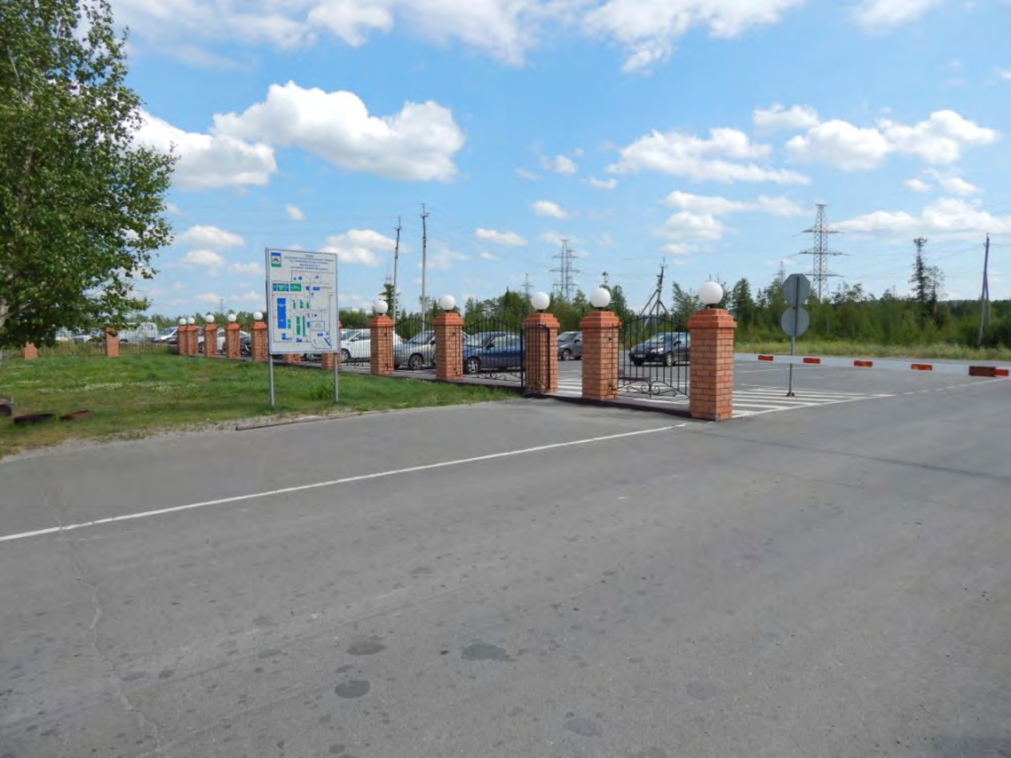
Схема территории Информационно-справочный указатель для посетителей Учебно-научного центра «Институт проблем механики» РАН г. Ижевск